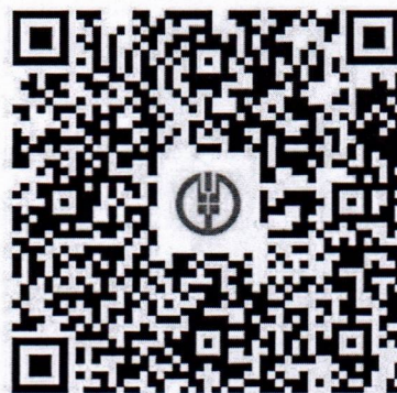
电子商务学校（培训费）