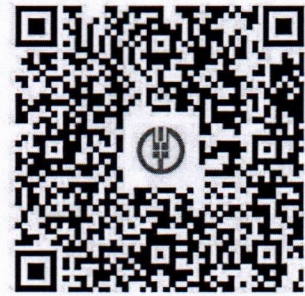
电子商务学校（培训费）